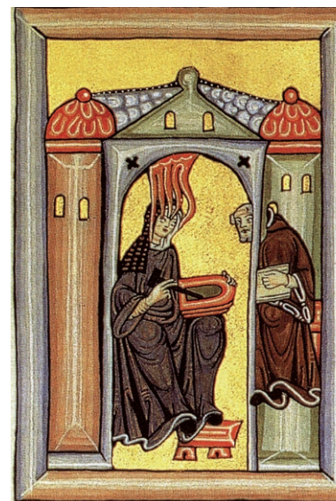
Hildegard diktiert Volmar eine Vision. Miniatur aus dem Rupertsberger Codex des Liber Scivias

Hildegard von Bingen – eine Frau, an der sich die Geister scheiden, bis heute. Prophetin und Mystikerin nennen sie die einen, die anderen machen sich mit esoterischem Interesse an ihrem Werk zu schaffen. Eine rein naturverbundene Sicht auf Hildegard von Bingen wird dieser außergewöhnlich begabten Frau nicht gerecht. Sie komponierte, dichtete und betrieb Kirchenpolitik. Vieles aus dem Werk und auch dem Leben der Hildegard mutet heute erstaunlich modern an und fasziniert gerade deswegen viele auch der Kirche fern stehende Menschen. Ihre Rede von der „Harmonie und Symphonie der Schöpfung“, ihr Wissen über die heilende Wirkung von Pflanzen, ihre ganzheitliche Sicht von Mensch und Kosmos lassen den zeitlichen